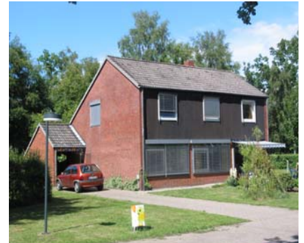
Bilder: Eindrücke aus dem SOS-Kinderdorf Worpswede

Seit über 40 Jahren bietet das SOS-Kinderdorf Worpswede Kindern, die nicht bei ihren Eltern leben können, ein Zuhause. Dort finden sie eine liebevolle Umgebung und individuelle, verlässliche und qualifizierte Förderung. Damals wie heute bilden die Lebensgemeinschaften der SOS-Kinderdorf-Familien den Kernbereich der Arbeit. Darüber hinaus hat das SOS-Kinderdorf, entsprechend des Bedarfs in der Region, differenzierte Hilfsangebote für junge Menschen und ihre Familien entwickelt.